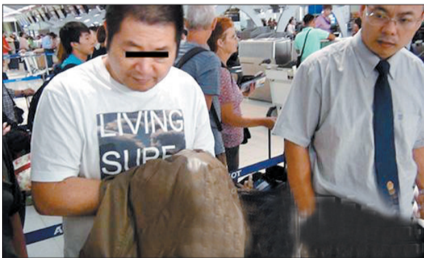
犯罪嫌疑人(左)