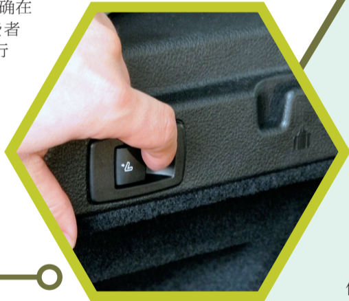
放倒后排座椅的按钮