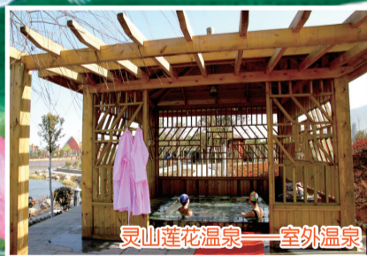
灵山莲花温泉——室外温泉