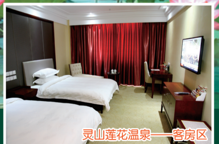
灵山莲花温泉——客房区