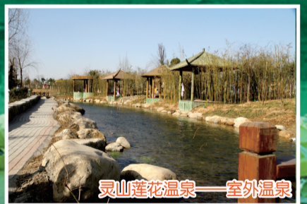
灵山莲花温泉——室外温泉