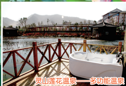
灵山莲花温泉——多功能温泉