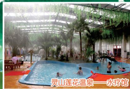
灵山莲花温泉——水疗馆