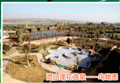
灵山莲花温泉——鸟瞰图