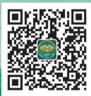
洛阳灵山莲花公园订房网