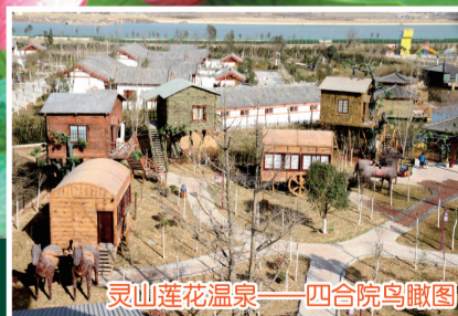
灵山莲花温泉——四合院鸟瞰图