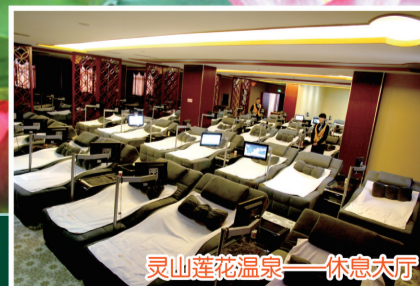
灵山莲花温泉——休息大厅