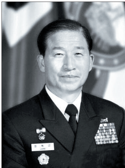
韩国海军退役上将郑亿根(资料图片)