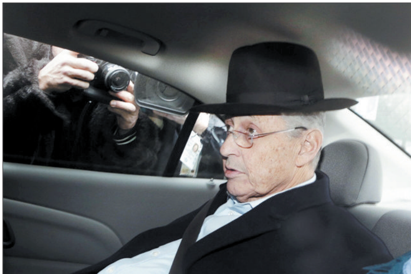
1月22日,西尔弗抵达纽约南区联邦法庭