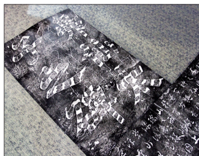
《升仙太子碑》拓片局部