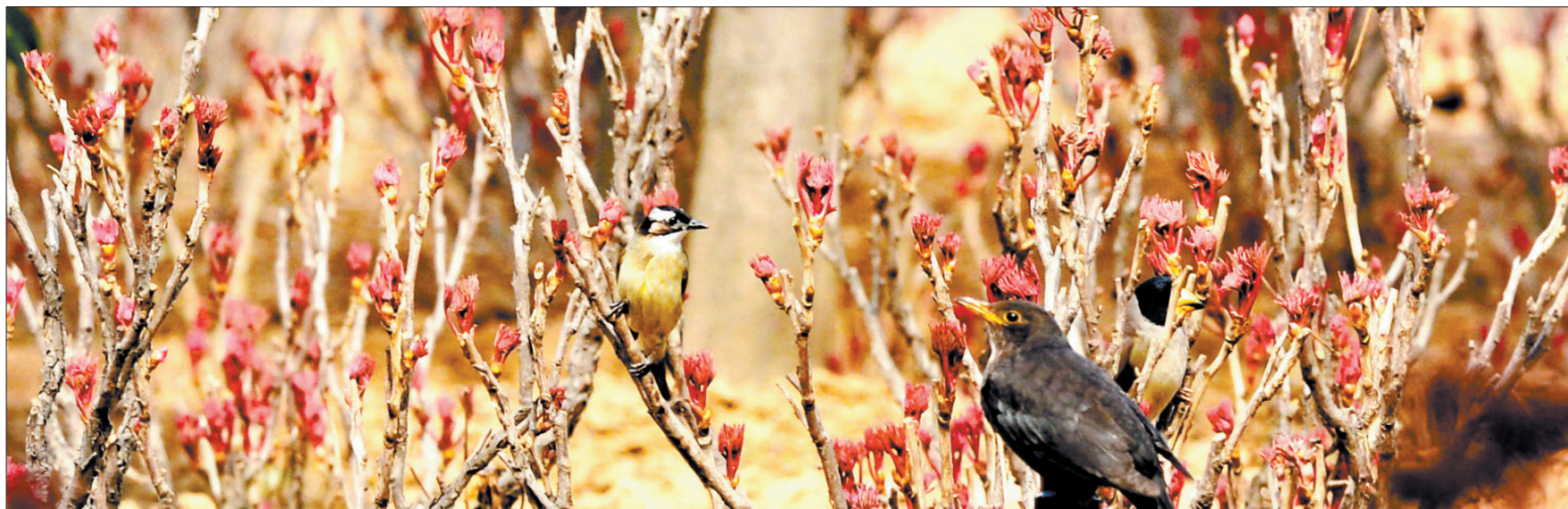
阳光明媚,鸟儿在牡丹枝头晒太阳