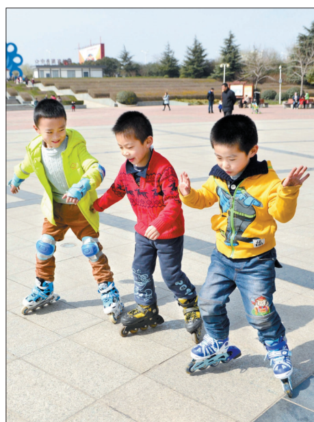
小朋友耍得美着哩