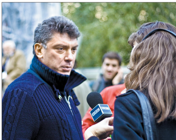
鲍里斯·涅姆佐夫在莫斯科参加集会的资料照片 (2009年10月7日摄)

法新社援引调查人员的话说,凶手应该对涅姆佐夫的行程计划颇为熟悉,“根据调查,鲍里斯·涅姆佐夫当时正与女伴前往他的公寓,那里距事发地点不远。显而易见的是,这起罪行的策划者和实施者得知了他的计划路线”。