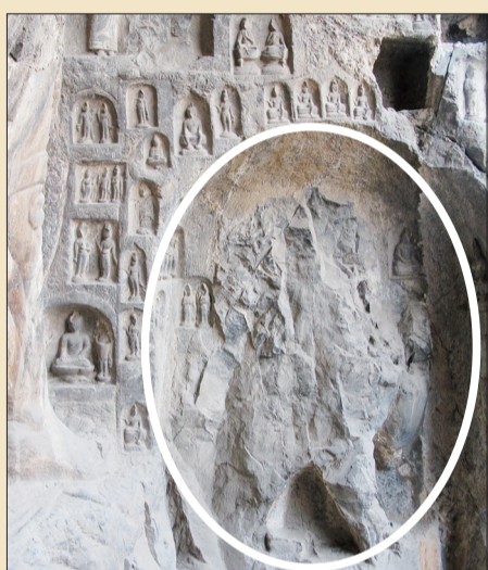
万佛洞北側石狮被盜舊位置

为了保证作品评选的公开、公正,欢迎广大热心读者报名担任评委,读者可以通过微信、微博私信报名,晚报将成立热心读者评委团。同时,为了更好地服务读者,如果有商家愿意为热心读者提供礼品,欢迎拨打66778866洽谈合作事宜。