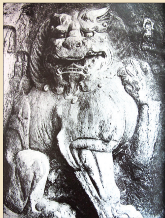
北側石狮

名称: 北側石狮 高133厘米 年代: 唐代 位置: 美国堪萨斯州纳尔逊艺术博物馆 现藏: 美国堪萨斯州纳尔逊艺术博物馆