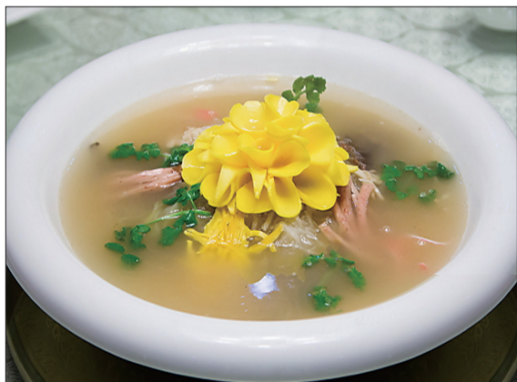
牡丹燕菜 (资料图片)