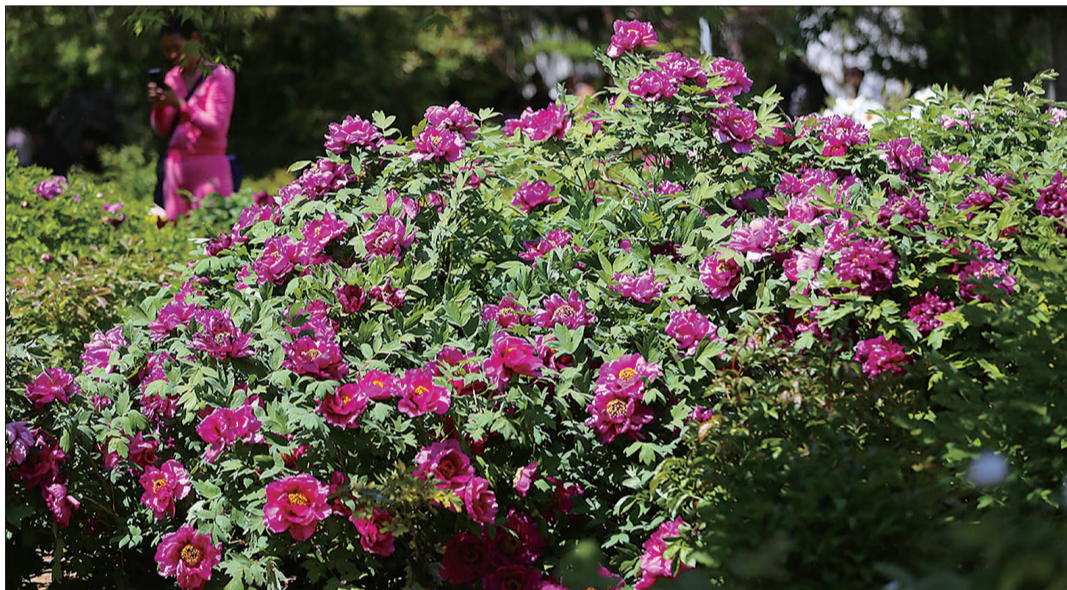
这株高大的牡丹树上开满了紫红色的牡丹花