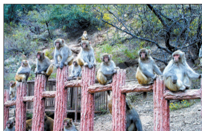
五龙口猕猴

在济源北下高速,行驶近3公里即到猕猴王国,这里有猕猴16群3800多只,小猴子或躺或坐,或灵动或呆滞,或嬉戏或闭目养神,十分可爱。