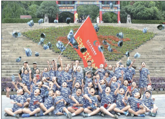
往年夏令营活动现场 (资料图片)

小记者军事文化夏令营通过对营员们进行封闭式军事训练和学习教育，使营员们锻炼身体、增强体质、磨炼意志；通过各种各样的军事拓展游戏，使营员们自信、自立、自强；通过真人CS知识讲解，装备熟悉，实战演练，阵地战、夺旗战、遭遇战，设卡、设伏、搜救、潜伏等，使营员们相互信任、相互支持、团结协作。在奔跑、射击、对抗中，营员们释放平时在生活、学习中