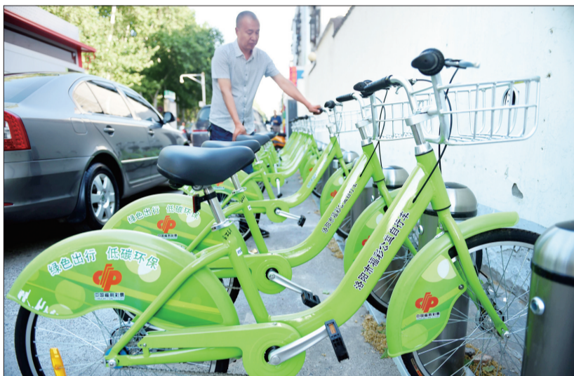
公益自行车二期上线