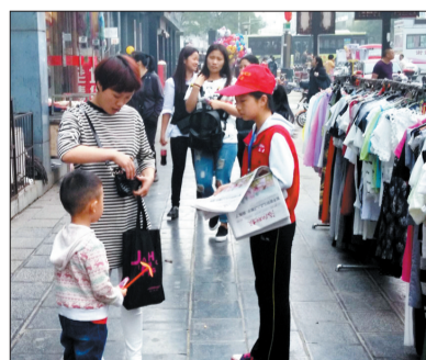
小记者们在义卖报纸

5月9日,为迎接母亲节的到来,小记者采访采风周周行带领上百名小记者在老城区十字街、西工区王府井百货门口、涧西区上海市场大张门口参与了“感恩母亲”小记者母亲节大型街头义卖报纸活动,当天共义卖出《洛阳晚报》5000余份,小记者用自己的劳动所得给妈妈送上了一份最难忘的礼物。