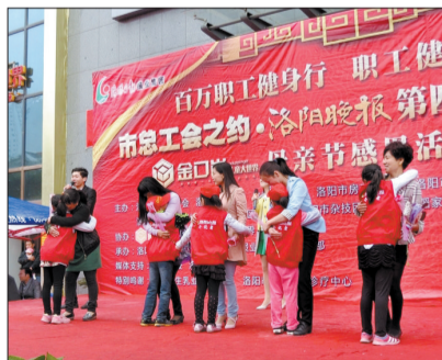
金口岸母亲节活动现场

5月10日,上百名小朋友来到金口岸儿童大世界,参加了母亲节专场活动,小朋友们现场进行报纸义卖,并走上舞台为妈妈献上康乃馨,说出对妈妈的祝福。