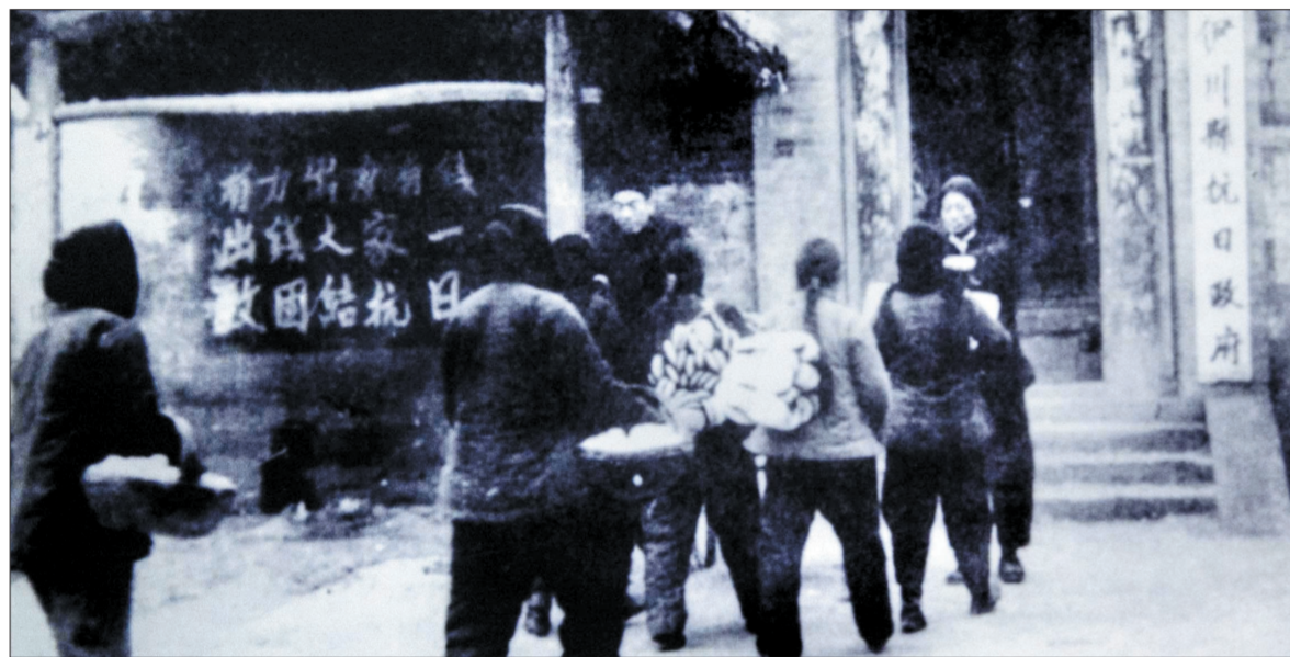
一九四四年十一月,伊川县抗日政府成立,当地群众纷纷捐献钱物支持抗战 (资料图片)