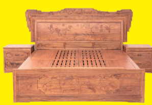
花梨木东方雅韵大床 特价:1.58万元