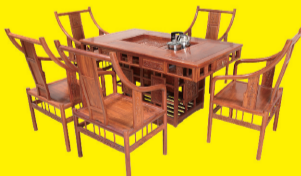
花梨木罗马茶台(6件套) 特价:9980元