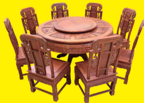
花梨木1.38米圆台(9件套) 特价:1.68万元