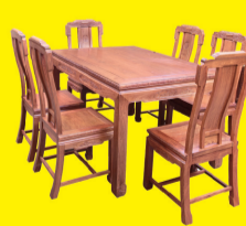
花梨木东方雅韵长餐桌(7件套) 特价:1.58万元