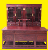
酸枝木书房系列(5件套) 特价:4.38万元