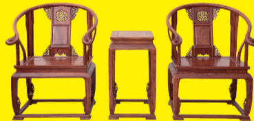
酸枝木皇宫椅(3件套) 特价:8800元