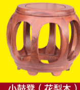
小鼓凳(花梨木) 特价:380元