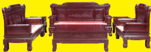
檀酸枝木兰亭序沙发(10件套) 特价:5.78万元