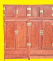
花梨木顶箱柜 特价:1.98万元