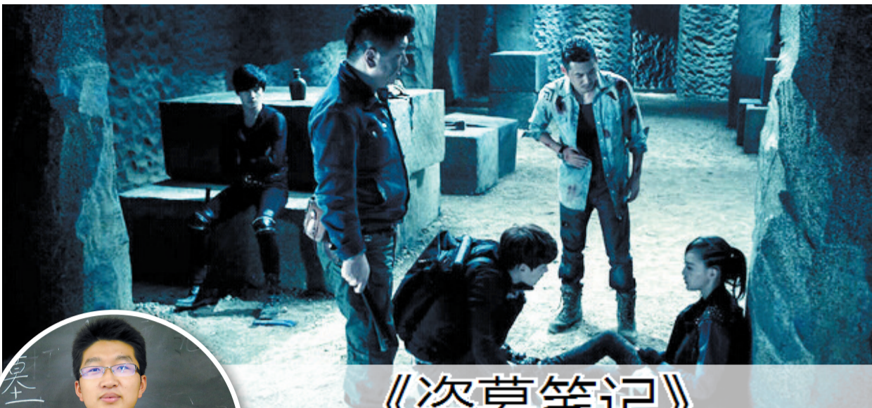
电视剧《盗墓笔记》剧照 (资料图片)