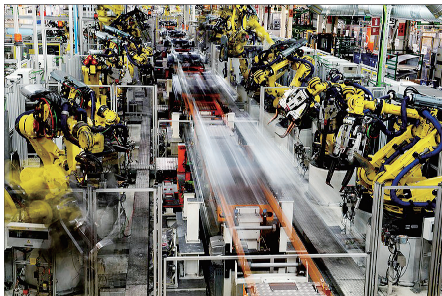
德国大众公司装配线上的机器人

这组机器人本计划在安装流水线上工作,能在指定空间内抓取并处理汽车零件。事发时有另一名工作人员在场,此人并没有受到任何伤害。英国《每日邮报》说,希尔威格拒绝进一步透露细节,只是说调查正在进行,初步调查结果显示,这是一次人为事故,不是机器人本身的问题。