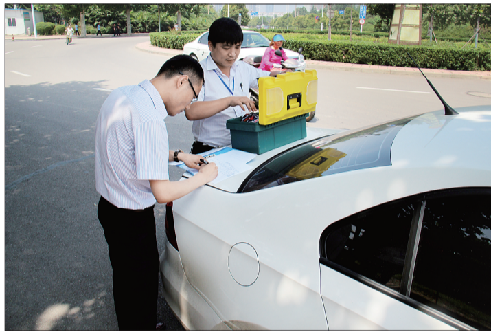
车辆理赔服务暗访检查现场

据洛阳市保险行业协会的工作人员介绍,此次检查共对我市24家财产险会员单位的车险理赔查勘情况进行检验。检查流程为,先从车险信息平台随机抽取各财产险会员单位的车辆信息,协会调查人员得到信息后采取现场模拟报案的形式,对会员单位的服务进行考评。