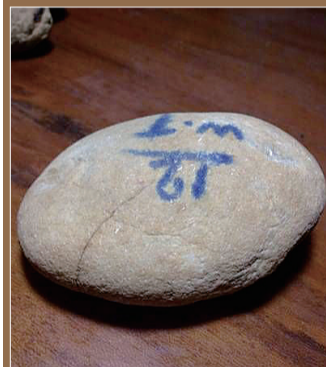
达马坎场区的黄沙皮翡翠原石