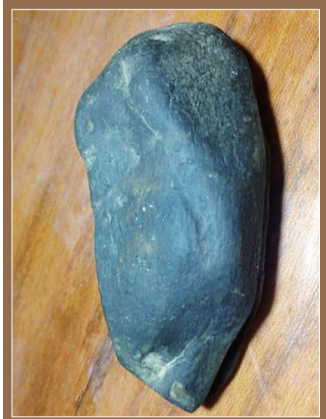
格英角场区的黑乌砂皮翡翠原石