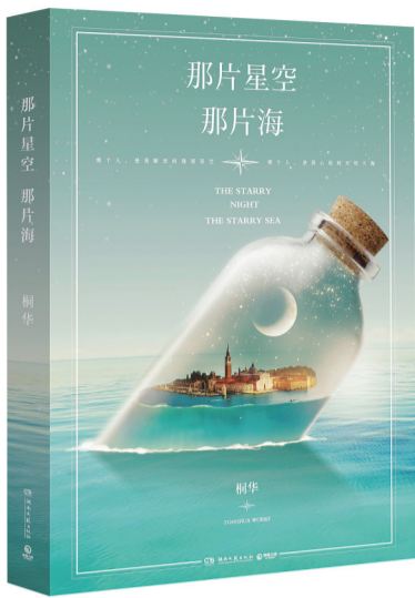
人鱼与她 梦幻童话

洗完手，走出厨房，看到他正一件件翻看衣服，他拿起一包内裤仔细看着。我的脸有些烫，忙移开视线，匆匆走进客厅，大声说：“你去冲个澡吧，然后换上新买的衣服，如果不合适，我明天拿去换。用一楼的卫生间，换下来的衣服，你要是还要就自己洗干净，要是不要，就扔到垃圾桶里。”