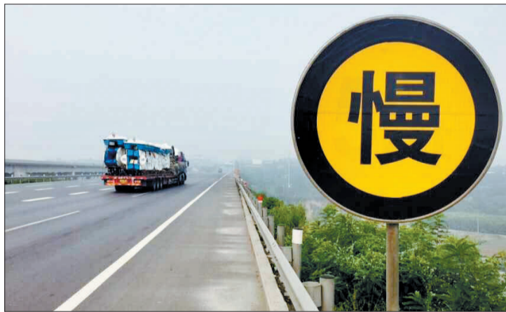
瀍河大桥上竖立着醒目的黄色警示牌

该工作人员提醒市民，在发生事故后，一定要在事故现场后方放置三角警示架，提醒来往车辆。车上的人员要在第一时间从车中撤出，转移到安全地带等候救援。