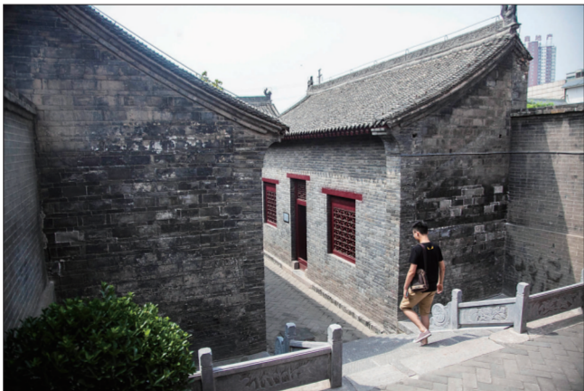
八路军驻洛办事处纪念馆