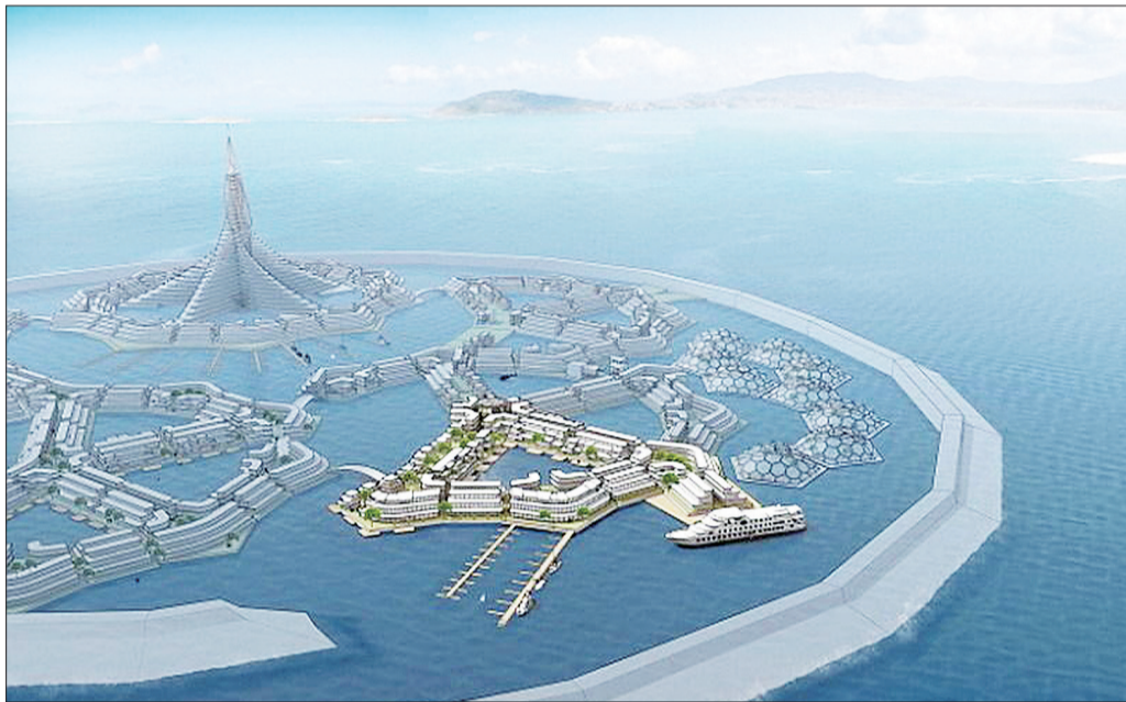
中等规模的海上漂浮城市