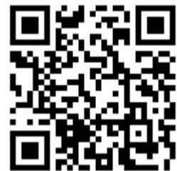
扫二维码 观看相关视频

科学家对此表示担忧,因为这些海洋浮游生物是众多海洋生物的食物,此举或引发食物链方面的风险。