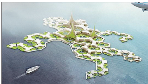
能重新组合的海上漂浮城市