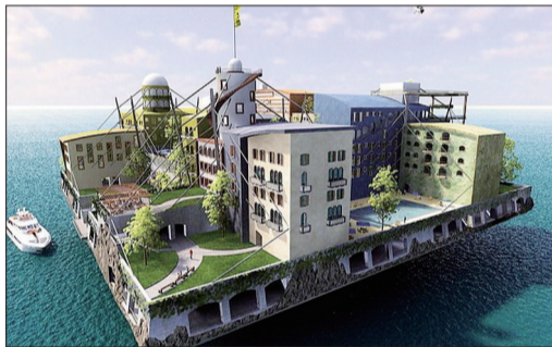
迷你型海上漂浮城市