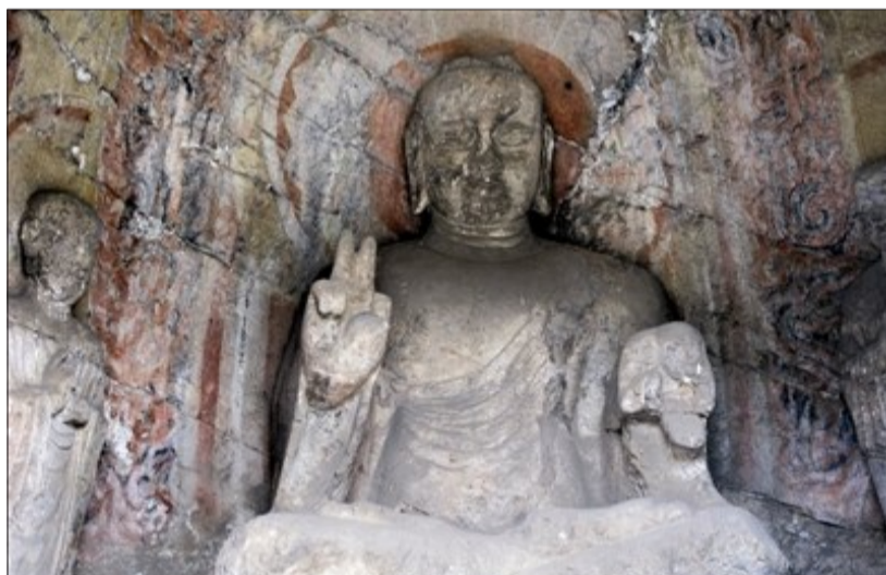
宾阳北洞阿弥陀佛被网友称为“剪刀手大佛” (资料图片)

游客可以通过手机随时购买电子门票,购票渠道包括在龙门石窟官方微信服务号内购票、景区入口购票墙扫码购票、在各类宣传广告等媒介上扫码购票等。这样可以让游客避免在高峰期排队购票,也减轻了景区的售票压力。