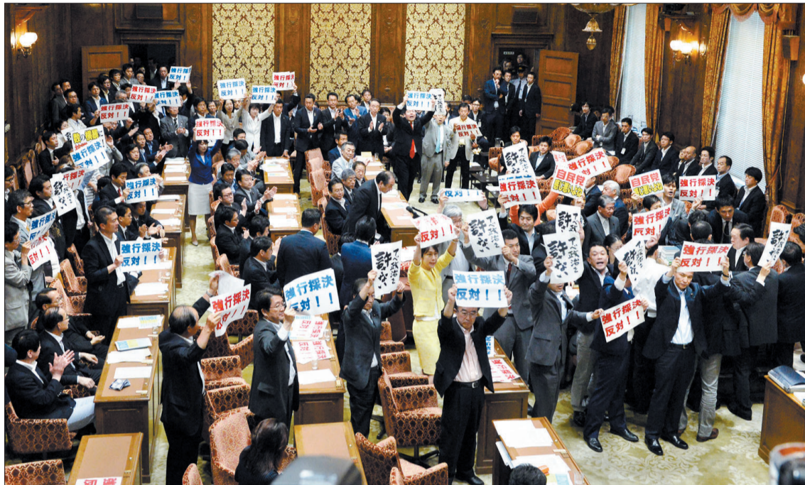
7月15日,在野党议员阻止国会众议院和平安安全法制特别委员会对安保法案进行表决 (新华社发)