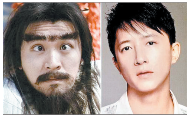
韩庚(右)将接替周星驰出演《大话西游3》