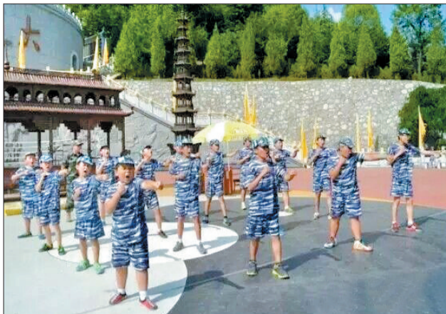
小营员：看我练的军体拳