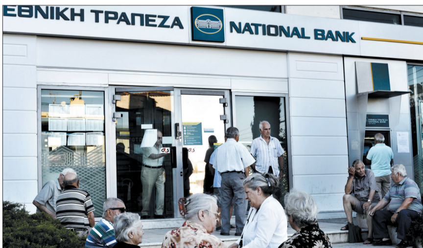
7月20日,在希腊雅典,人们在一家银行外等待