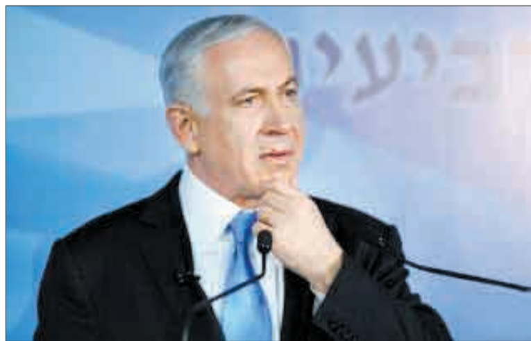
以色列总理内塔尼亚胡