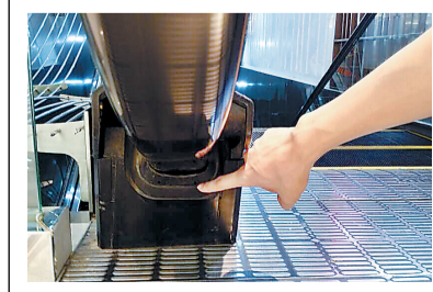
文字整理 赵夏楠 图表绘制 赵韵

王牛森称,整部自动扶梯有20多个安全保护装置,在电梯出现不同故障或危急时刻,会采取不同的保护措施,降低伤害。