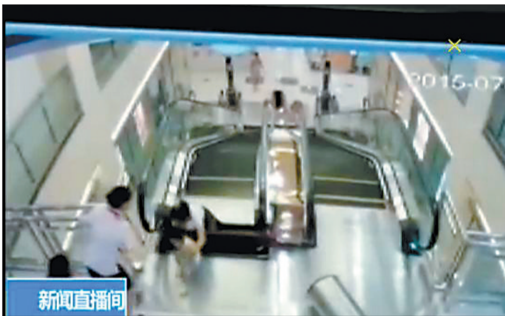
女子被卷入电梯后,奋力将孩子举出 (视频截图)

荆州市安监局局长陈观鑫昨日称,经初步了解,当时电梯并不是和网上传言那样处于维修状态。如果是维修,肯定是要对电梯停运或在电梯口设置警示牌,这都是操作规程的。当时是商场工作人员发现电梯出现异常,所以在电梯口提醒顾客。目前,事故原因仍在进一步调查。