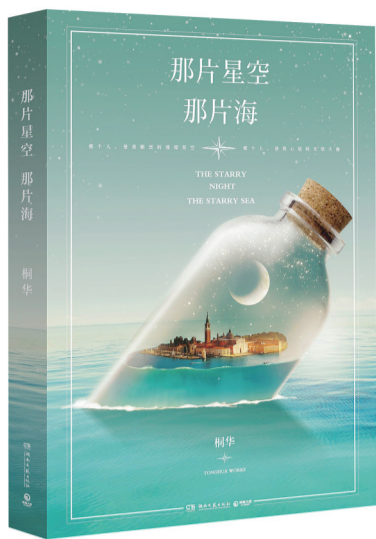
人鱼与她 梦幻童话