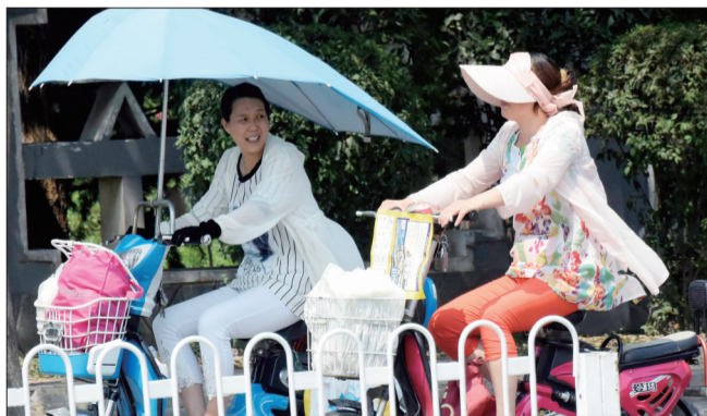
高温酷暑,市民全副武装

由于资源有限,并不能保证所有公交线路都配备空调车。“对于线路较长、乘坐率较高的线路,如6路、7路、53路、60路等,我们会尽可能多地调配空调车。”该工作人员说。