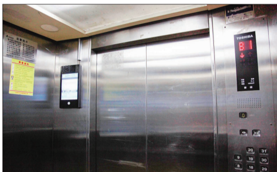
未张贴电梯使用标志,属违规运行

“根据估算,每台电梯每年的维保费用为3500元至4000元,维保单位才能‘顾本’,但在目前市场上,个别维保单位对每台电梯每年的维保收费甚至不到2500元。”业内人士称。低价之下,弄虚作假、偷工减料、使用低价劣质配件等手段,成了个别维保单位的赚钱途径。维保人员超负荷工作,也延误了部分电梯乘客的营救时间。今年,我市有3家维保单位因维保不规范被质监部门处罚。