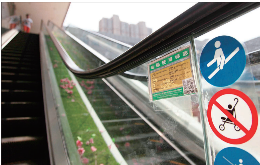
贴有电梯使用标志,且标志尚在有效期内,电梯才可运行