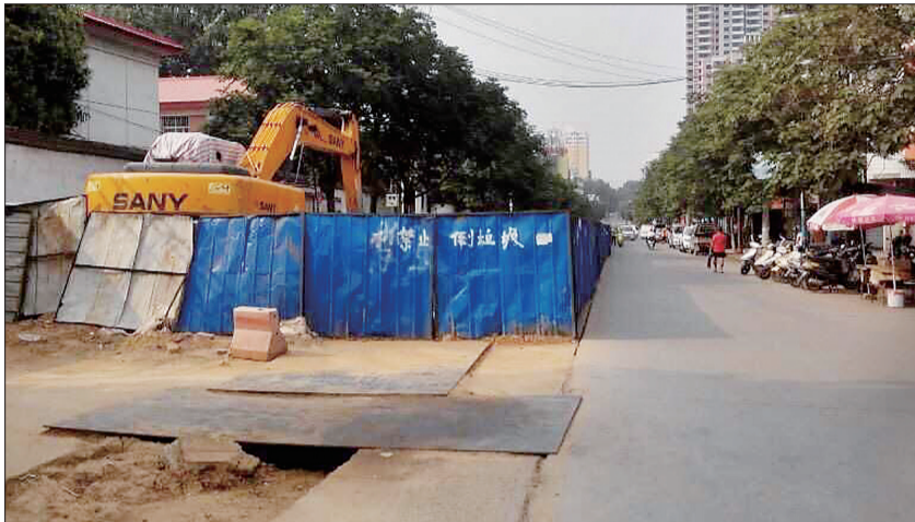
施工管道占了半条马路