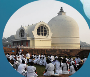
印度拘尸那迦 (佛祖涅槃地)