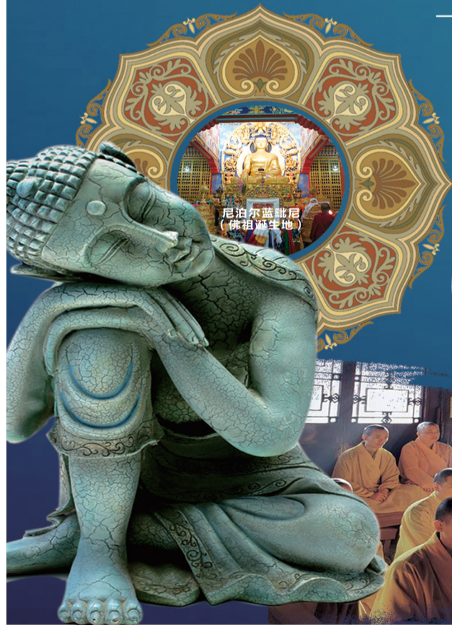
尼泊尔蓝毗尼 (佛祖诞生地)