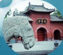
白马寺 (中国佛教的释源和祖庭)