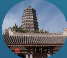
宝鸡法门寺 (佛祖的指骨舍利供奉地)