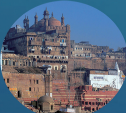
印度瓦拉纳西 (佛祖悟成大道地方)