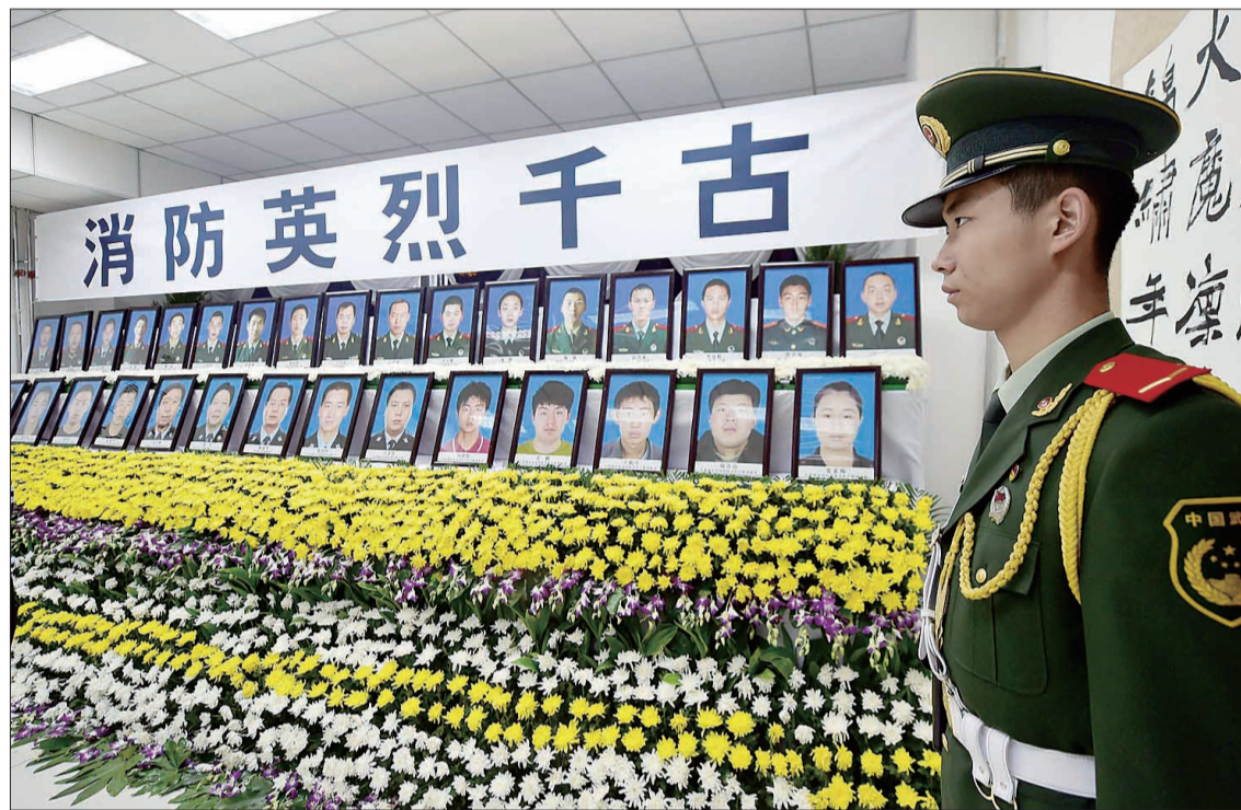
天津市公安消防局开发支队建的临时灵堂