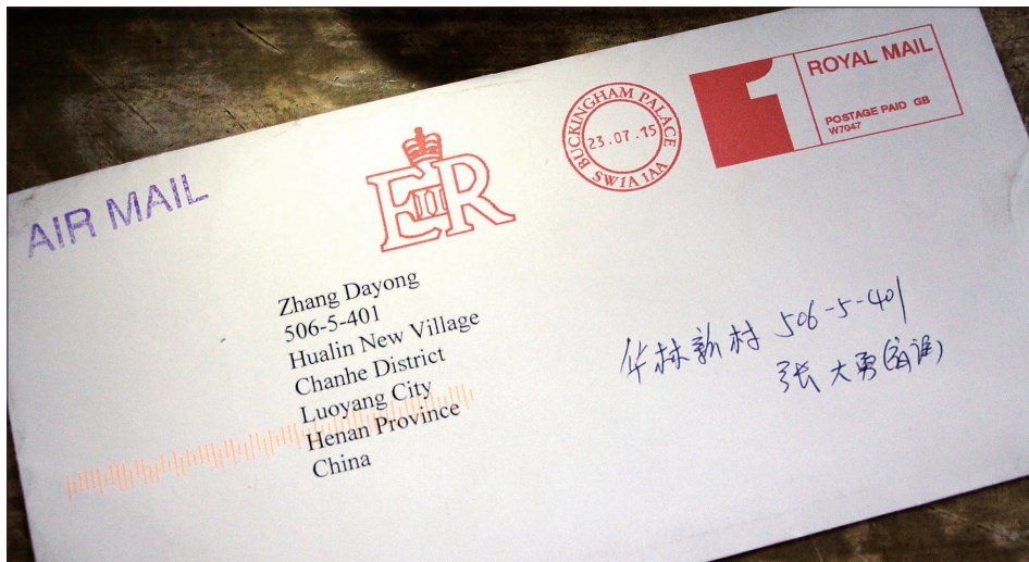
英国王室回信的信封