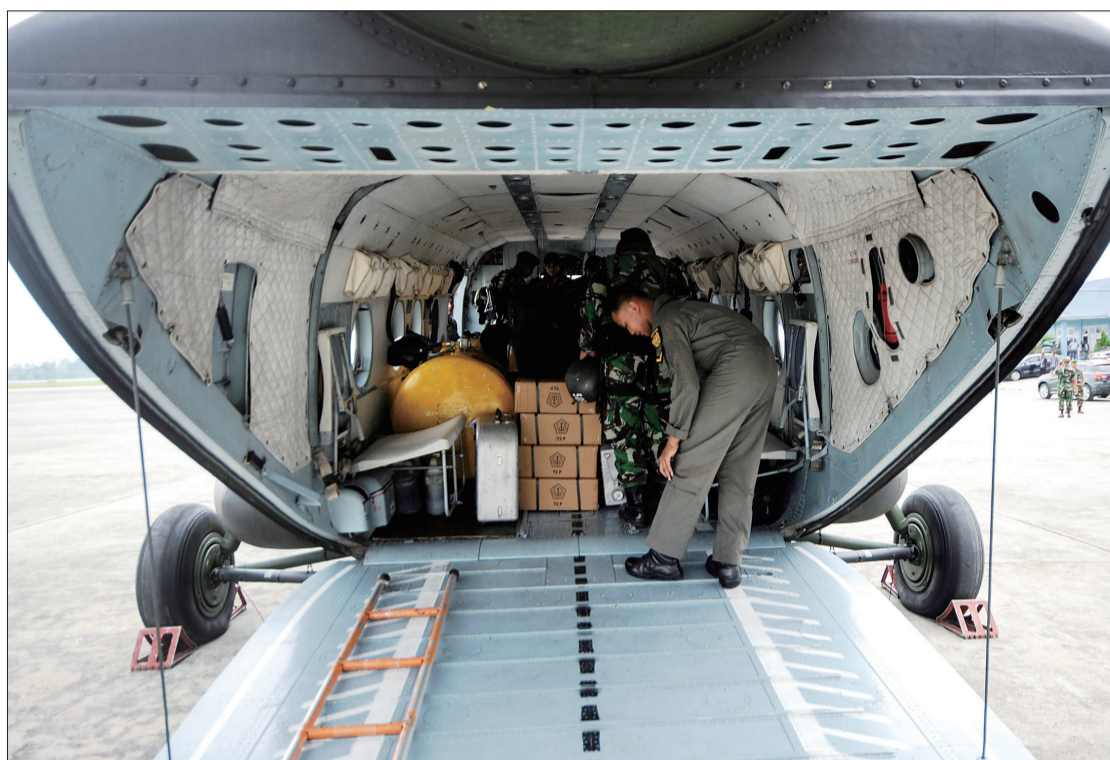
8月18日,在印尼查亚普拉,士兵准备前往坠机事故现场开展搜救工作