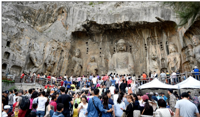
在十一长假期间,龙门石窟游人如织,秩序井然

今年河洛文化旅游节期间,龙门石窟、白马寺分别接待游客46.2万人、18.93万人。