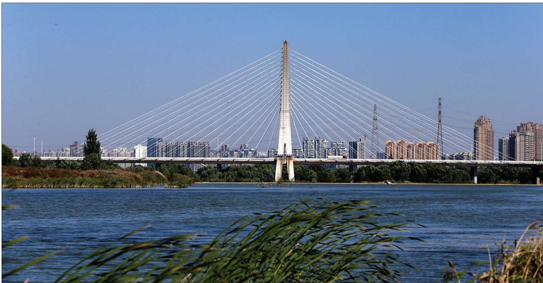
凌波大桥美景如画