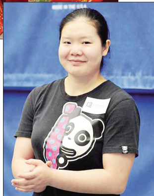
程菲发福了