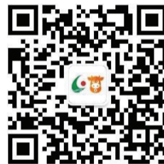
洛阳晚报-省乐购二维码

报名方式:扫描下面的二维码,进入洛阳晚报-省乐购,点击“美食美客播报团粉丝招募”,填好你的信息并发送,就算报名成功了。我们将从报名者当中抽取8名幸运粉丝,进行电话通知。