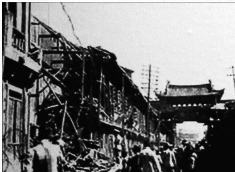
遭日机轰炸后的洛阳城 (资料图片)

日本鬼子猖狂到了是忍孰不可忍的地步,欺负中国国弱民穷买不起枪炮,想来就来,来了狂轰滥炸一番,炸了就走。百姓恨得咬牙切齿,企盼着我们能有飞机和高射炮