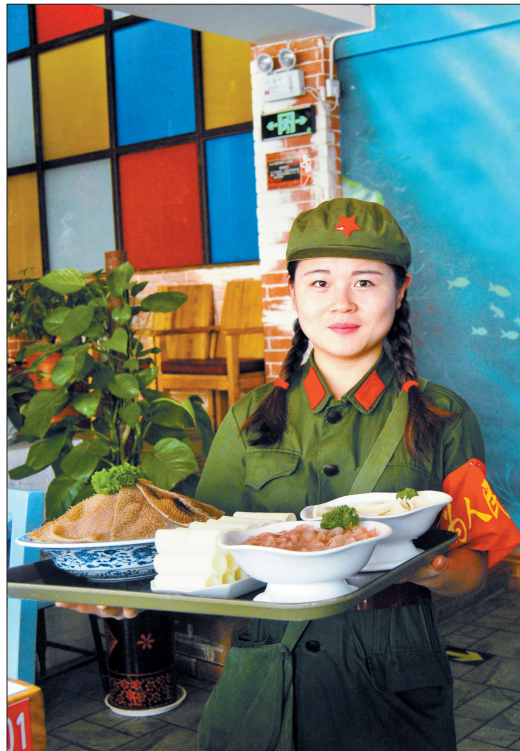
穿着“军装”的服务员

这家饭店名字就叫年代公社,怀旧主题非常突出,二八自行车、小木马、保温瓶……店里随处摆放的老物件,时时把您拉回那个年代。