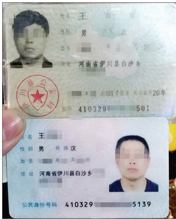
王先生取款时被要求证明这俩身份证是同一个人的