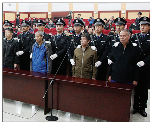
庭审现场

2013年11月22日10时25分,位于青岛经济技术开发区秦皇岛路与斋堂岛街交叉口的东黄输油管道原油泄漏现场发生爆炸,造成63人遇难、156人受伤,直接经济损失人民币75172万元。