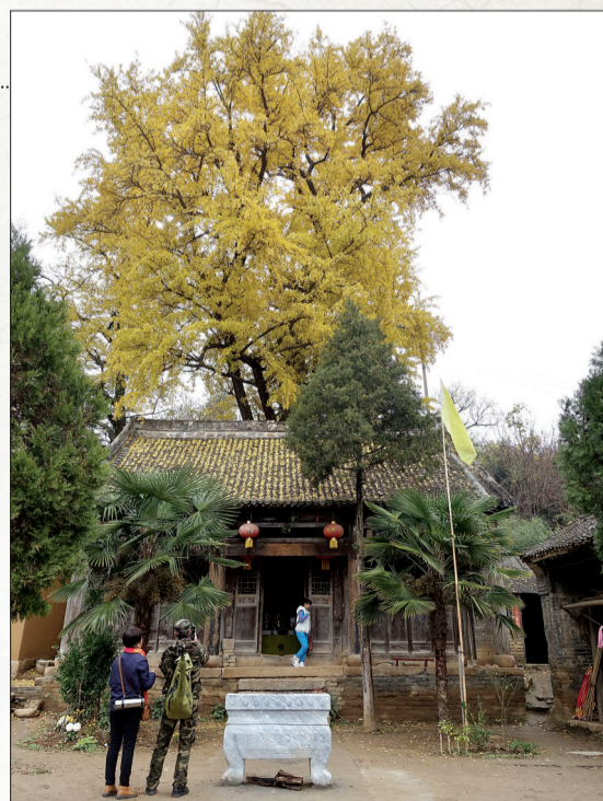
银杏树与云岩寺相伴千年

■ 投稿邮箱:wbheluo19@163.com ■ 电话:0379-65233686