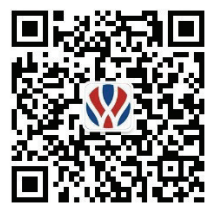
「雅文集团」 微信公众号二维码