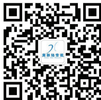
奥斯陆雪道 微信公众号二维码