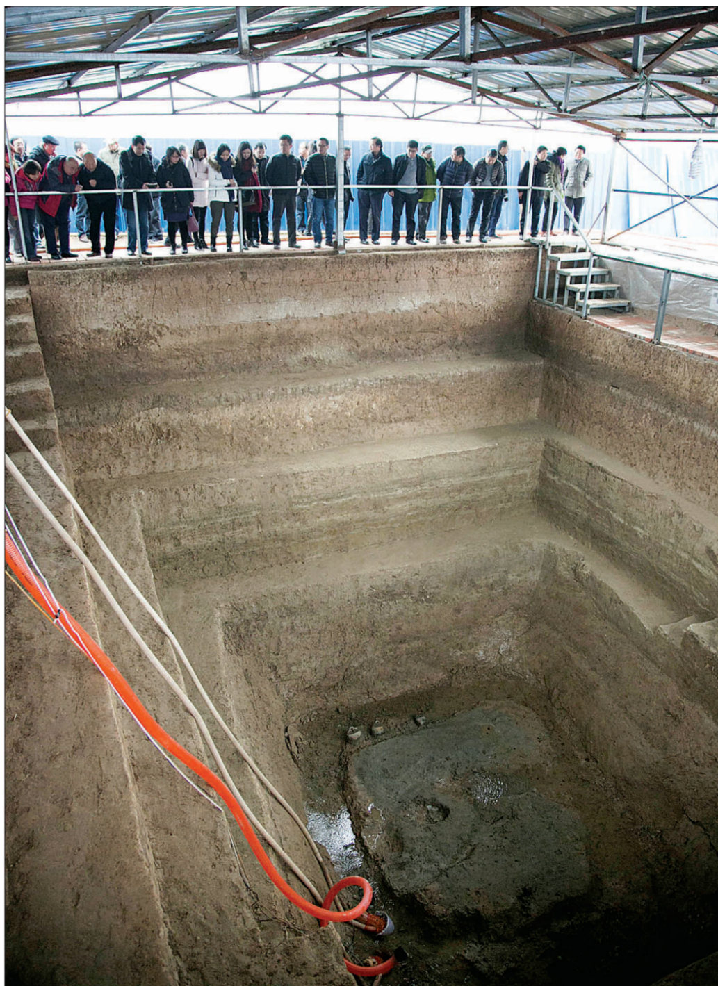
专家们实地探访徐阳墓地

经常在考古发掘时与水打交道的江苏省考古研究所所长林留根也提出,从目前的情况看,这座大墓尚未被盗过,内部肯定非常完整,因此建议,在不破坏文物的前提下,尽可能想办法解决水的问题。比如,可以从底部的泉眼和水系着手,找到水的流动方向,在外围打探井抽水等。实在不行,就只能采取“分块整取”的方式。白云翔表示,无论采用哪种方法解决渗水问题,都需要拿出比较详细、严谨的方案。